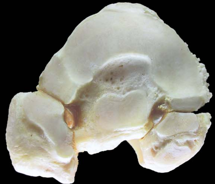
Cara articular para el tarso